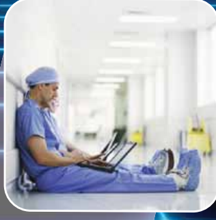
Hastane ve Sağlık Kompleksleri