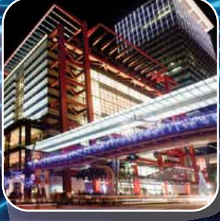
İş ve Alışveriş Merkezleri