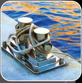
Marina & Limanlar