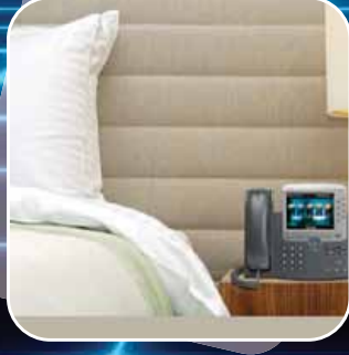
Otel ve Turizm