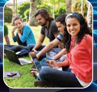
Üniversite ve Eğitim Kurumları